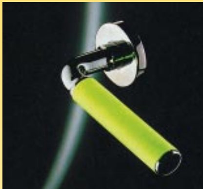
Die neuartige Edelstahl-Türklinke speichert das Licht. Auch am Tage wirkt sie ausgesprochen attraktiv

Die Lichtberatung sollte gekonnt in das gesamte Dienstleistungspaket eingebunden sein. Wenn es gelingt wesentliche Produkt-Highlights zum Thema Licht professionell zu präsentieren, werden die Kunden schnell erkennen, daß die offerierte Leistung mit anderen nicht vergleichbar ist. Immer mehr Bäderbauer setzen in ihren Beratungen Musterobjekte einer besonders attraktiv gestalteten Lichtschalter-Kollektion ein. Das Erfolgsgeheimnis liegt darin, auch im Produktsegment Licht und Beleuchtung immer up to date zu sein. So hat ein Bäderbauer aus Unterfranken seine Kunden für einen außergewöhnlichen Design-Schalter des