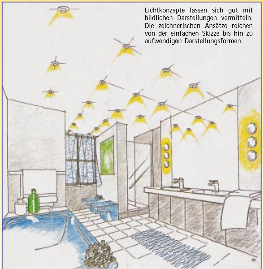
Lichtkonzepte lassen sich gut mit bildlichen Darstellungen vermitteln. Die zeichnerischen Ansätze reichen von der einfachen Skizze bis hin zu aufwendigen Darstellungsformen