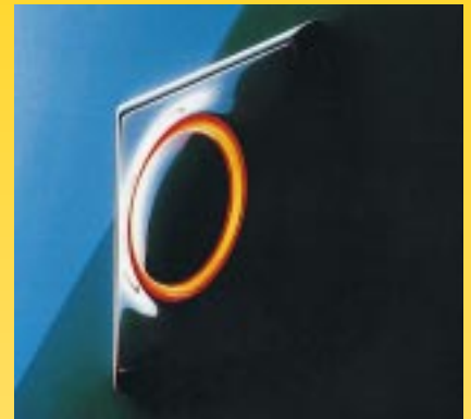
Der Parallelhub an diesem raffinierten Design bietet den Vorteil, daß der Verwender an jeder Stelle der Betätigungs-wippe drücken kann, um zu schalten

Knopfdruck kann der Kunde schnell die geeigneten Lichtquellen für seine Sanitär- und Fliesenfarbe erkennen. Zumindest einige Hersteller von Badmöbeln haben endlich reagiert. Für die Beleuchtung im Spiegelbereich stehen unterschiedliche Beleuchtungsvarianten zur Auswahl. So kann der Bäderbauer die Lichtquelle für den Spiegel oder Spiegelschrank abgestimmt auf die gewählte Sanitärfarbe bestellen. Eine besonders raffinierte Lösung hat sich ein italienischer Hersteller von Waschtischanlagen ausgedacht. Das integrierte Lichtbord besitzt ein innovatives Beleuchtungssystem, das sowohl Kunstlicht abstrahlt, als auch Tageslicht simuliert, und so z. B. das Auftragen von Make-up erleichtert. Die zuletzt gewählte Lichtstufe bleibt bis zum nächsten Einschalten gespeichert.