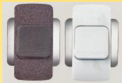
Dieses Lichtschalter-Sortiment ermöglicht eine Materialabstimmung mit Naturstein im Bad

Ein Bäderbauer aus Ingolstadt konzipierte für einen betuchten Kunden vor wenigen Jahren ein exklusives Marmorbad. Die Kundin suchte sich ihren leuchtend weißen Marmorblock höchstselbst in der Toscana aus und kennzeichnete ihn mit ihrer Signatur. Aus dem ausgesuchten Gesteinsblock ließ der Ingolstädter Bäderbauer Wand- und Bodenbeläge, sowie die Waschtischanlage für das Badezimmer fertigen. Als die letzten Arbeiten erledigt waren und auch die Beleuchtung installiert war, erlebten die Beteiligten (zuvorderst die Kundin) ein Fiasko. Der ehemals strahlend weiße Marmor wies jetzt einen gelblichen Schleier auf. Was war passiert? Als Lichtquelle für die