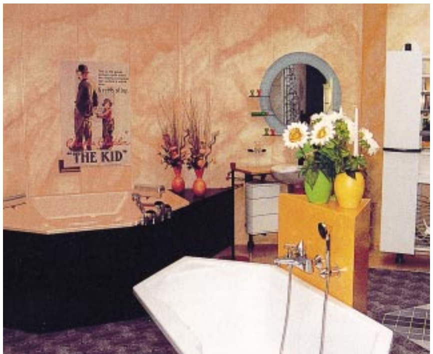
Moderne Kojengestaltung mit Spachteltechnik

Gestalterische Kompetenz muß einem nicht in die (Gen-)Wiege gelegt sein. Auch durch Wachheit, offenes Interesse und die Lust an schönen Dingen eröffnen sich Wege zum besonderen Bad. Und dabei muß „besonders“ keinesfalls immer gleichbedeutend mit „teuer“ sein. Kreative Lösungen bestehen durch Raffinesse und Ideenreichtum. Viele Bäderbauer beweisen mittlerweile, daß Designer-Tapeten, Spachteltechniken und andere raffinierte Wandbeläge zu zusätzlichen Umsatzträgern im Badverkauf werden können. Eine junge Magdeburger Chefin ist der Meinung, daß die Kunden angesichts der enormen Produktvielfalt überfordert sind und bietet deshalb ihren besonderen Service an: „Wir sind dazu da, geschickt zu kombinieren, damit alles harmoniert.“ Dabei setzt sie auch Designer-Tapeten im Bad ein. Damit wird sie dem Wohntrend gerecht, der die „Schlachthausatmosphäre“ (bis an die Decke geflieste Wände) in der Naßzelle endlich ablöst und stattdessen einen lebendigen Materialmix im Badezimmer entstehen läßt. Die experimentierfreudige Chefin wählte für ihr Bad-