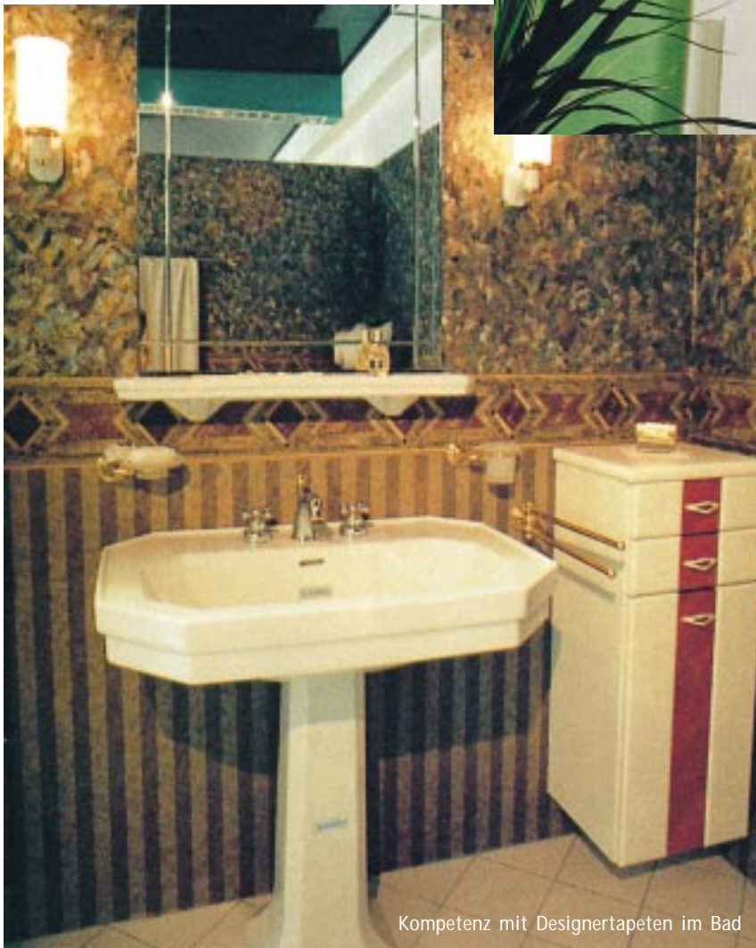
Kompetenz mit Designertapeten im Bad

W er kennt nicht die Geschichte von dem Betrunkenen, der sich verirrt an der Litfaßsäule entlang tastet. Er gerät immer mehr in Panik und ruft schließlich aus: „Hilfe, ich bin eingemauert!“ Wie leicht kann dem Manne geholfen werden. Erforderlich ist lediglich eine einfache Änderung des Blickwinkels. In der Bäderbranche geht es oft ähnlich. Ein kritischer Blick auf die Leistungspakete der Baumärkte, Seiten- und Quereinsteiger läßt erkennen, daß die Fachschiene die besseren Chancen hat, sofern die Bäderbauer das vorhandene Kompetenzpaket freudig dazu schnüren. Boden, Wand und Decke bieten Chancen zur unverwechselbaren Gestaltungskompetenz.