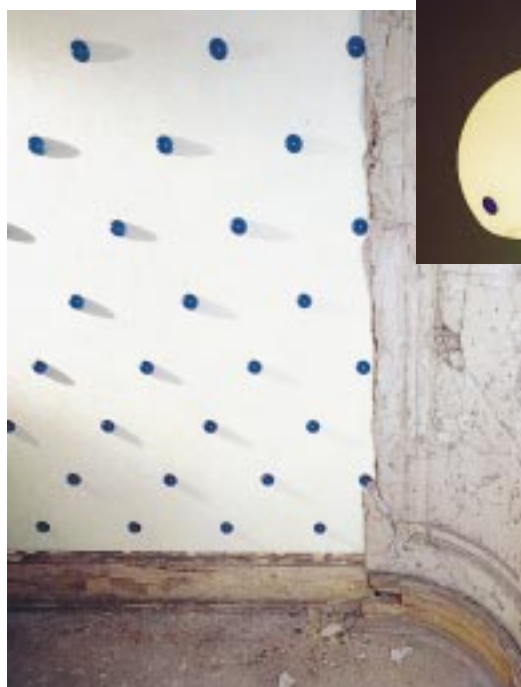
Designertapete mit Halbgglaskugeln und Pendelleuchte mit mundgeblasenem Glas

Z ur Raumgestaltung vorwiegend zur lebendigen Wandgestaltung, eignen sich zahlreiche weitere Produkte und Materialien, wie Spiegel, Glas, Edelstahl, Messing, Stoffbespannung oder auch hochglänzende Lacke. Eine innovative Badstudio-Chefin aus dem Schwarzwald setzt auf die Idee des „Andersseins“. Im attraktiven Studio wurde ein