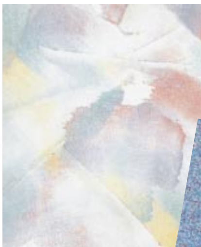
Neu belebt: die Spachteltechnik

Der Trend zur außergewöhnlichen Wandgestaltung im Badezimmer wird durch viele neue Produkte und Techniken unterstützt. Die Innenwand rückt mehr und mehr ins Blickfeld: aufwendige Gestaltungen, außergewöhnliche Techniken und hochwertige Materialien charakterisieren den Trend. Alte Techniken wie die neu belebte Spachteltechnik, kombiniert mit modernen Formen und Farben, ergeben Flächen von sehr eigenständigem Reiz und Charakter. Die Produkte sind auf wäßriger Basis konzipiert. Lösemittel und damit verbundene schädliche Emissionen spielen keine Rolle. In einem Badstudio bei Dresden empfiehlt die junge Chefin diesen dekorativen Wandbelag in der Badberatung jenen Kunden, denen die Liebe zu den schönen Dingen im Leben und der Spaß an außergewöhnlichen Effekten besonders