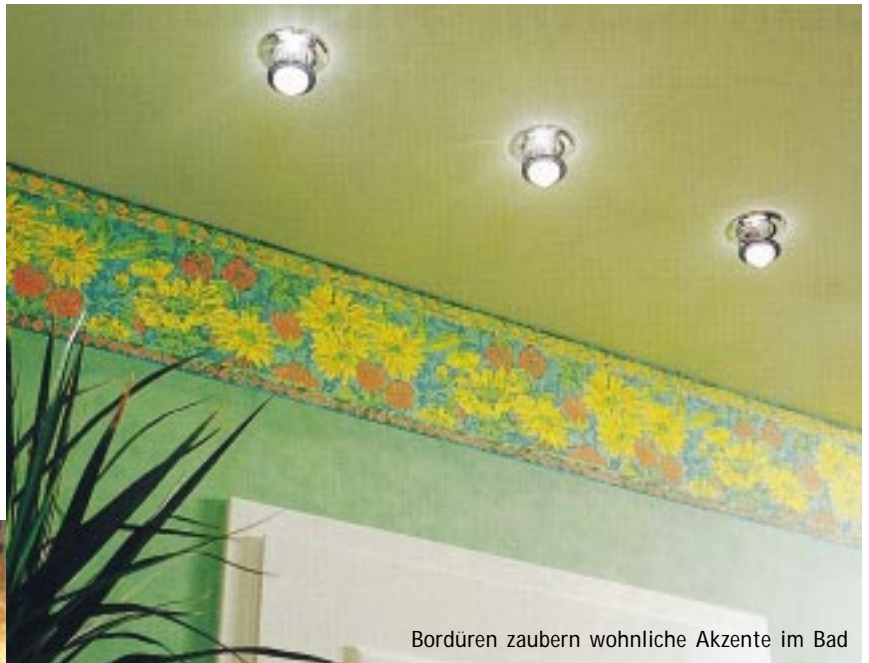
Bordüren zaubern wohliche Akzente im Bad

Qualifizierte Badgestalter/innen sind der entscheidende Schlüssel zum Erfolg mit Bädern. Deshalb bietet die bav-Serie „Modernes Badgestaltungs-Know-how“ grundlegende Tips und Ideen für Planung und Umsetzung aus der HaZweiOh-Basisausbildung Badgestalter/in. Der dritte Teil der Artikelreihe befaßt sich mit dem Thema „Wandgestaltung im Bad“